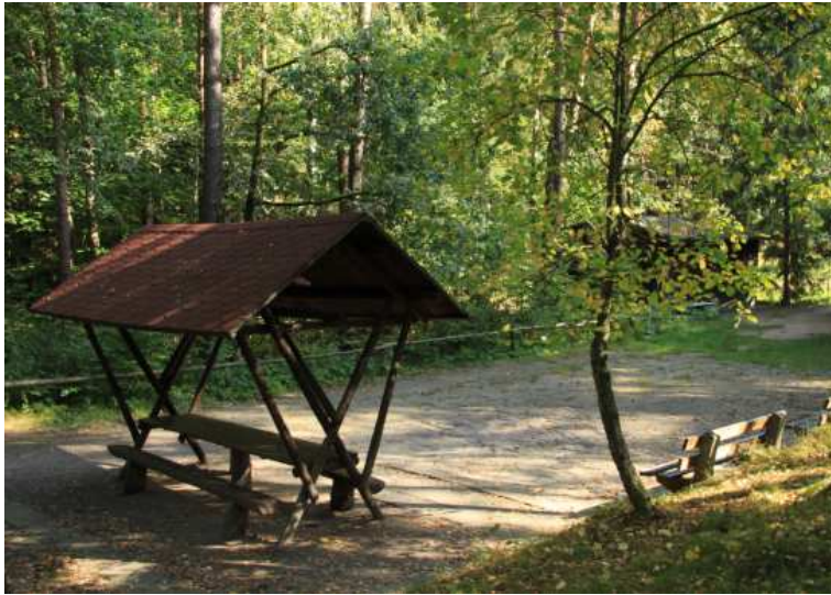
Zum Entspannen nach der Wanderung