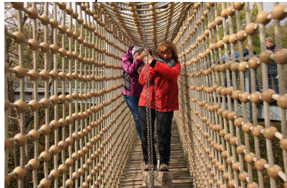
Klettereinlage auf dem Baumkronenpfad