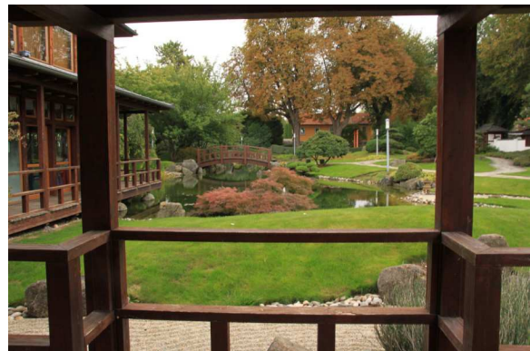
Im Japanischen Garten in Bad Langensalza