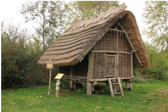
Das Opfermoor in Niederdorla