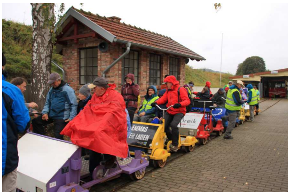
Sportlicher Einsatz bei einer Fahrt mit der Fahrrad-Draisine