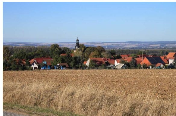
Blick auf Kammerforst