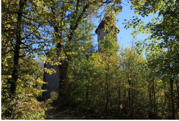
Die Burgruine Hainek bei Nazza